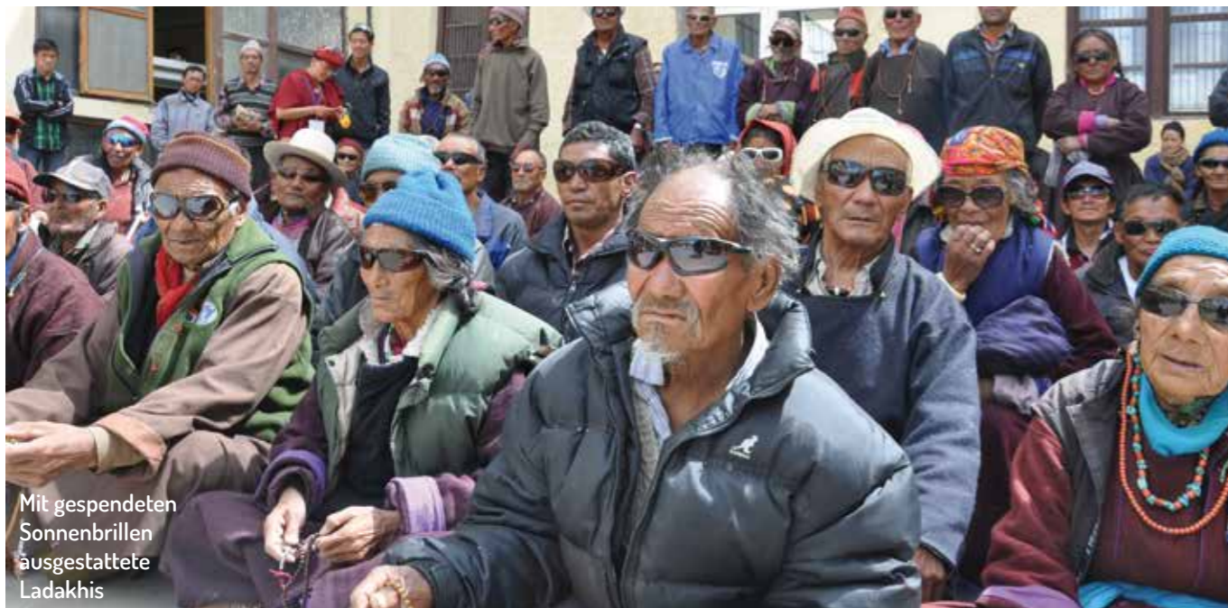
Mit gespendeten Sonnenbrillen ausgestattete Ladakhis