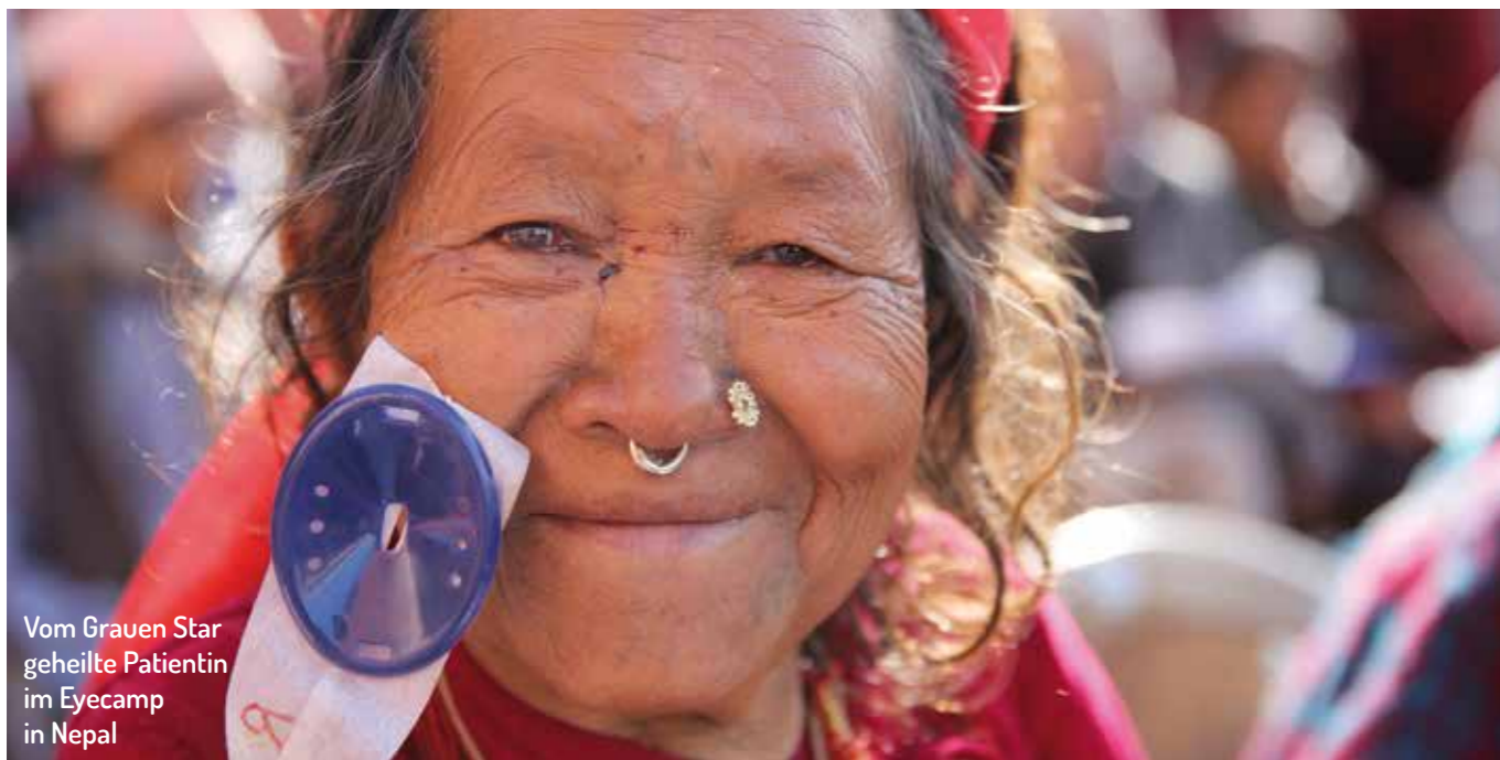
Vom Grauen Star geheilte Patientin im Eyecamp in Nepal