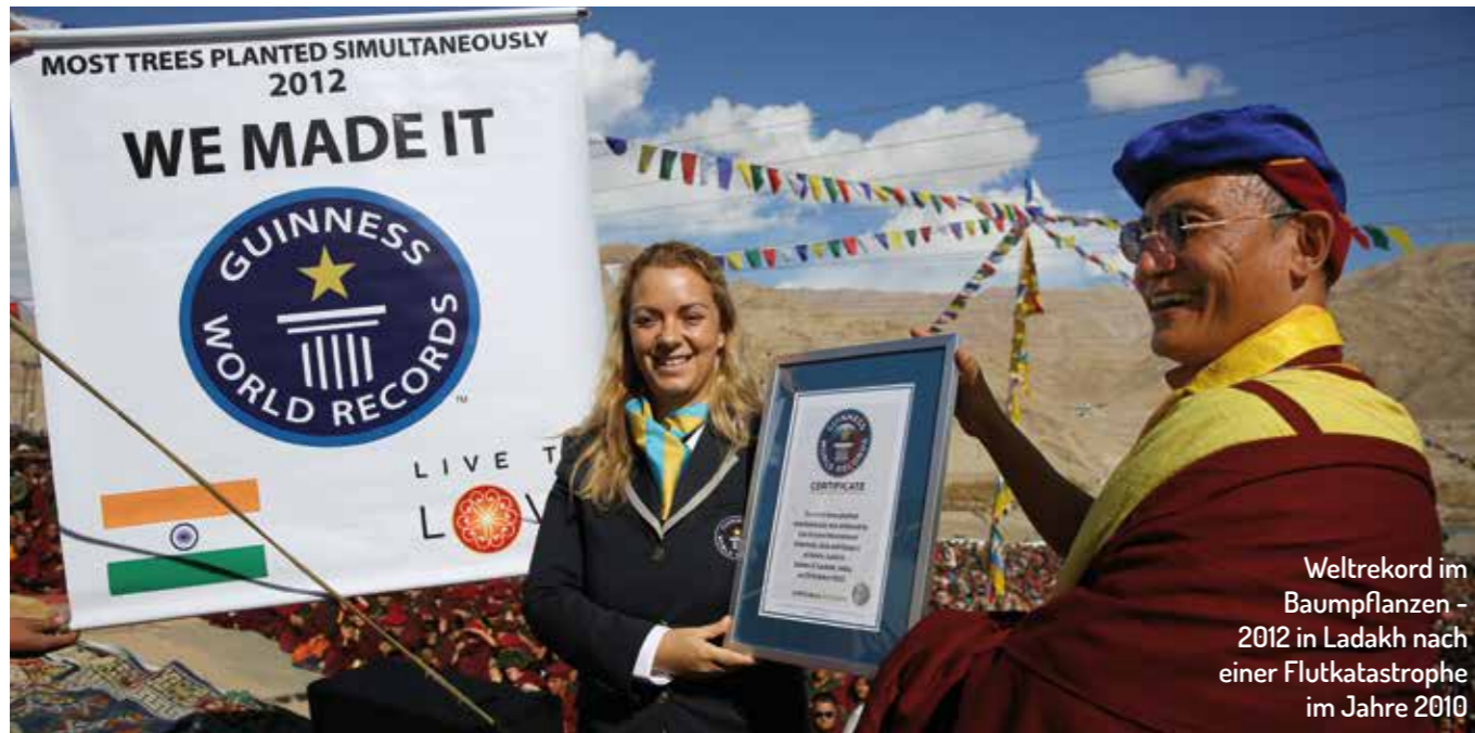
Weltrekord im Baumpflanzen - 2012 in Ladakh nach einer Flutkatastrophe im Jahre 2010