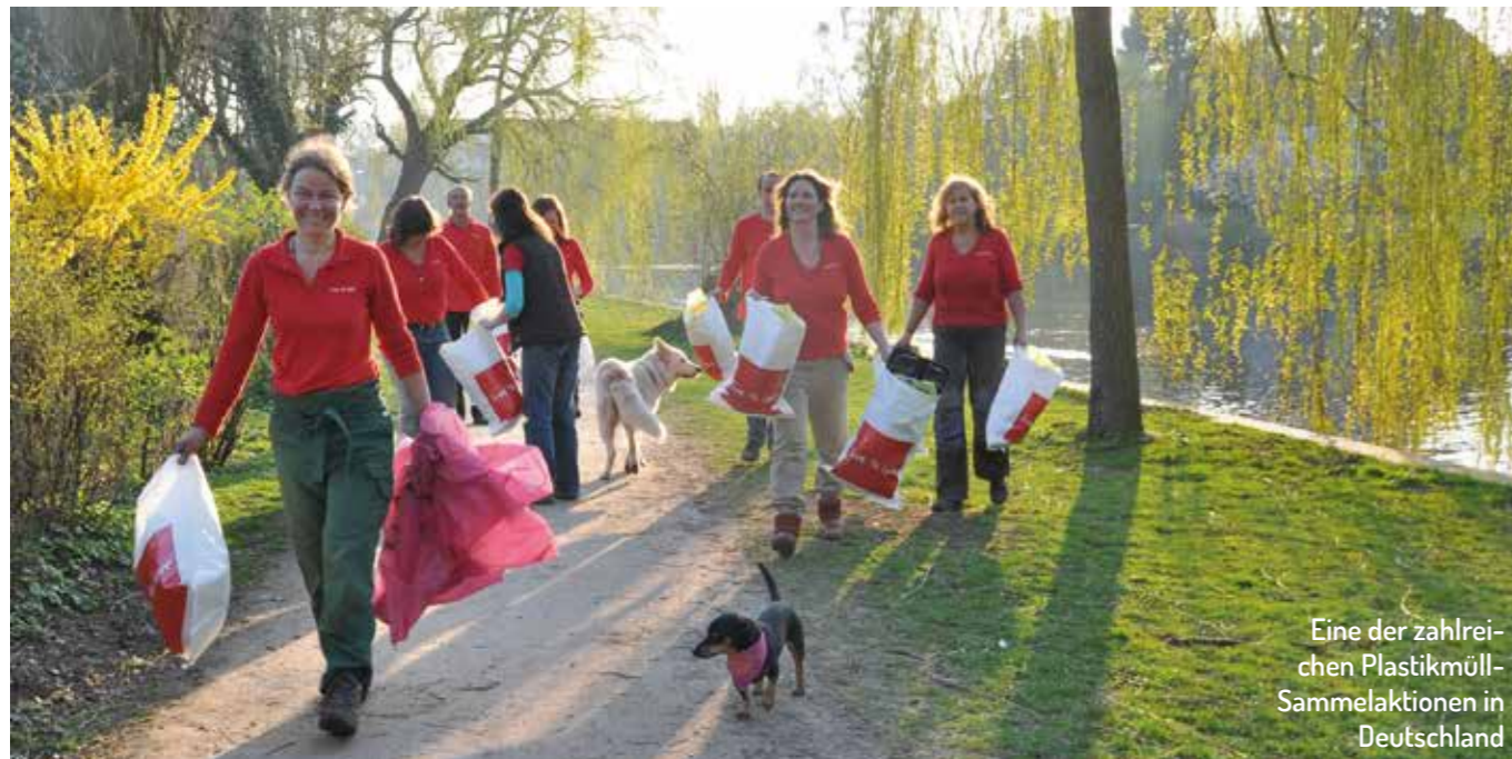
Eine der zahlrei- chen Plastikmüll- Sammelaktionen in Deutschland