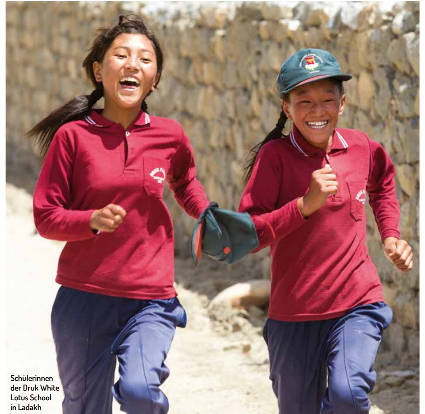
Schülerinnen der Druk White Lotus School in Ladakh

Gebt Frauen und Mädchen überall auf der Welt die Chance auf Gleichberechtigung. Setzt Euch für den Schutz unterdrückter Mädchen und Frauen ein. Unterstützt die Bildung junger Mädchen. Gebt Frauen Mikrokredite.