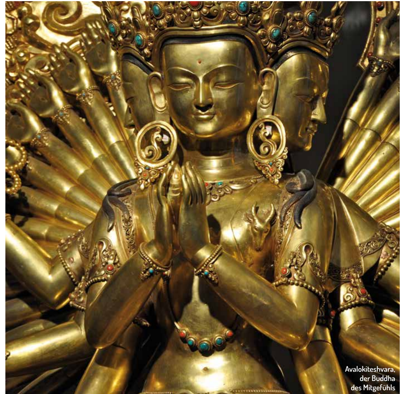
Avalokiteshvara, der Buddha des Mitgeföhls

Bewahrt alte Kulturen und Traditionen. Schützt das Weltkulturerbe. Erhaltet Baudenkmäler und Kunstschätze. Erlernt althergebrachtes Handwerk. Gebt Euer Wissen darüber weiter, seid Fürsprecher.